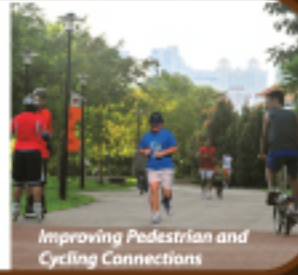
Improving Pedestrian and Cycling Connections

கட்டடங்களுக்கிடையே இணைப்புக் கூரைகள் கொண்டும் தடையற்ற நடப்பாதைகள் கொண்டும் இணைத்தல். குடியிருப்பாளர்களை நடக்கவும் மிதிவண்டி ஓட்டவும் ஊக்குவிக்க முயற்சிகள் எடுக்கப்படும்.