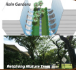
Retaining Mature Trees

முடிந்தவரை முதிர்ச்சியடைந்த மரங்களை பாதுகாக்க முயற்சிகள் எடுக்கப்பட்டுள்ளன. முடிந்தவரை மழைத் தோட்டம் மற்றும் மழைநீர் அறுவடைத் திட்டம் அமுல்படுத்தப்படும்.