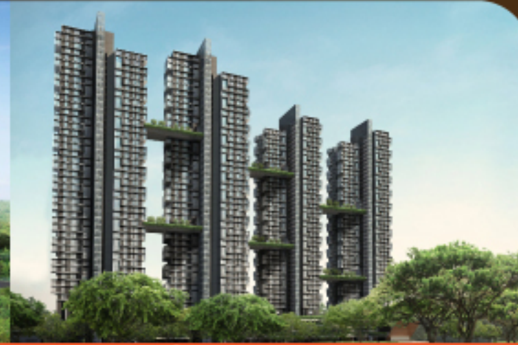
SKYTERRACE @ DAWSON