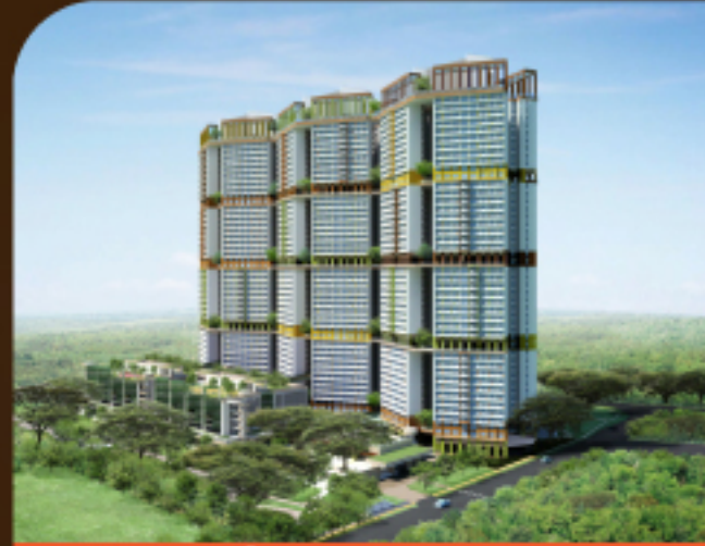
SKYVILLE @ DAWSON