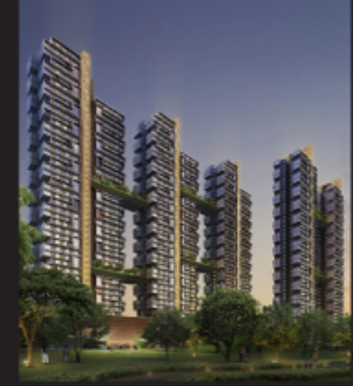
Illustrations are artist's impressions. Actual development may differ. 插圖為藝術家之創作，實際的發展可能會有所不同。

Presented by HOUSING & DEVELOPMENT BOARD MND SINGAPORE Participating Agencies Land Transport Authority Ministry of the Environment and Water Resources National Environment Agency National Heritage Board National Parks Board PUB Singapore Civil Defence Corps Urban Redevelopment Authority