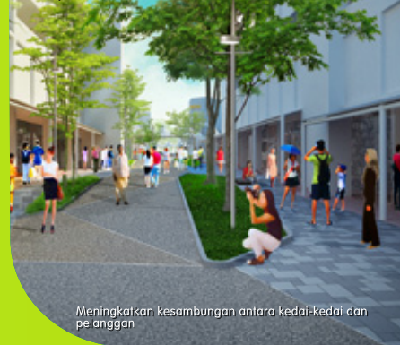
Meningkatkan kesambungan antara kedai-kedai dan pelanggan