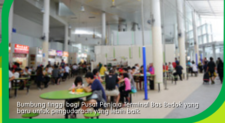
Bumbung tinggi bagi Pusat Penjaja Terminal Bas Bedok yang baru untuk pengudaraan yang lebih baik

High roof of the new Bedok Interchange Hawker Centre for improved ventilation.