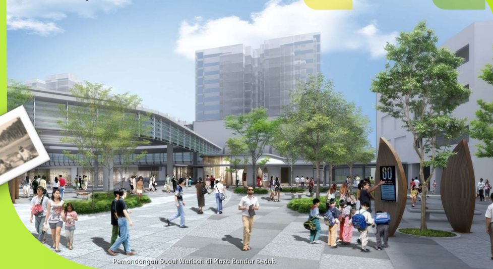
Pemandangan Sudut Warisan di Plaza Bandar Bedok