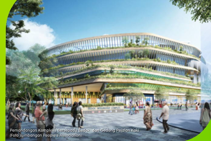
Pemandangan Kompleks Bersepadu Bedok dari Gedung Pejalan Kaki