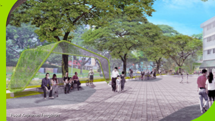
Pusat Kejurian Fengshan