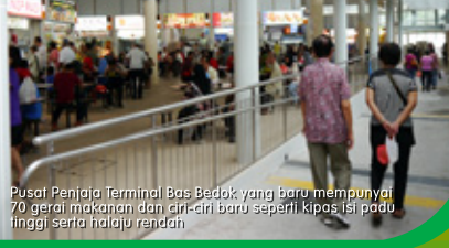
Pusat Penjaja Terminal Bas Bedok yang baru mempunyai 70 gerai makanan dan ciri-ciri baru seperti kipas isi padu tinggi serta halaju rendah

The new Bedok Interchange Hawker Centre with 70 food stalls and new features such as high-volume low-velocity fans