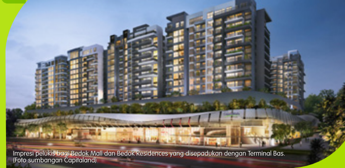
Impresi pelukis bagi Bedok Mall dan Bedok Residences yang disepadukan dengan Terminal Bas.