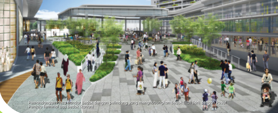
Pemandangan Plaza Bandar Bedok dengan pelindung yang menghubungkan Bedok Mall (kiri) dengan Pusat Penjaja Terminal Bas Bedok (kanan)