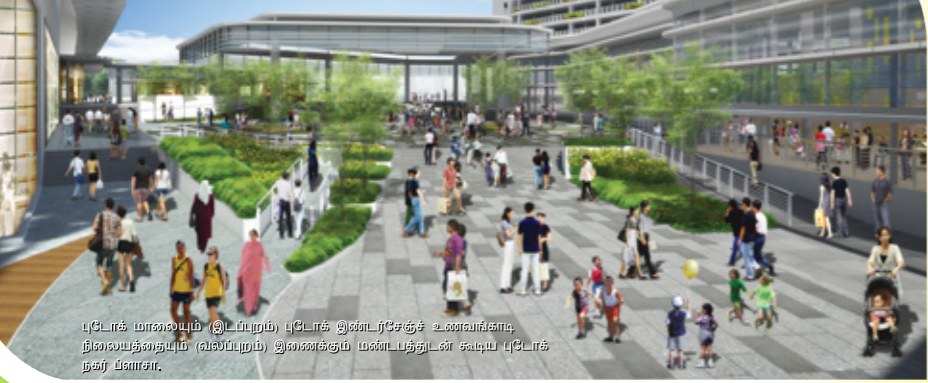
புடோக் மாலையும் இடப்பறம் புடோக் இண்டர்சேஞ்சு உணவங்காடி நிலையத்தையும் (வலப்பறம்) இணைக்கும் மண்டபத்தின் கூடிய புடோக் நகர் ப்ளாசா.