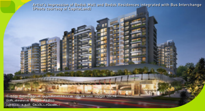
Artist's impression of Bedok Mall and Bedok Residences integrated with Bus Interchange

புடோக் நகர் மையத்தின் நடுவில் அமைந்திருக்கும் மரபுடைமை நிலையம் குடும்பங்களும் குடியிருப்பாளர்களும் சிங்கப்பூரின் மரபுடைமை பற்றி மேலும் தெரிந்து கொள்வதற்கான ஓர் இடமாகும்.