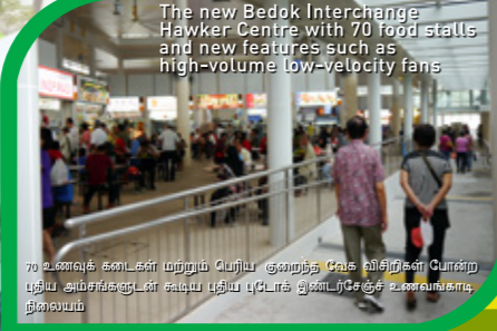
70 உணவுக் கடைகள் மற்றும் பெரிய குறைந்த வேக வீதிர்கள் போன்ற புதிய அம்சங்களுடன் கூடிய புதிய புடோக் இண்டர்சேஞ்சு உணவங்காடி நிலையம்

The new Bedok Interchange Hawker Centre with 70 food stalls and new features such as high-volume low-velocity fans