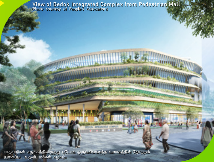
View of Bedok Integrated Complex from Pedestrian Mall

பாதசாரிகள் சதுக்கம், நிலவடிவமைக்கப்பட்ட நடைபாதைகள், வசதிகளுக்கு மேம்பட்ட இணைப்பு, புடோக் நகர் மையத்திற்கு ஒரு தனித்த அடையாளத்தையும் தன்மையையும் உருவாக்க மேம்பட்ட வசதிகள் ஆகியவற்றுடன் மேம்படுத்தப்படும்.