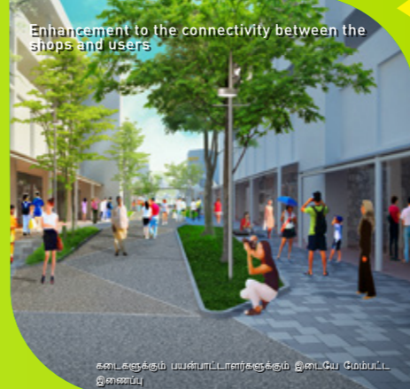
Enhancement to the connectivity between the shops and users

இந்த வளாகத்தில் கம்போங் சாய்ச் சீ சமூக மன்றம், புடோக் விளையாட்டு மையம், புடோக் பலதுறை மருந்தகம், புடோக் முதியோர் பராமரிப்பு நிலையம், புடோக் பொது நூலகம் ஆகியவை அமைந்திருக்கும்.