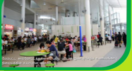
மேம்பட்ட காற்றோட்டத்தைக்கூடிய புதிய புடோக் இண்டர்சேஞ்சு உணவங்காடி நிலையத்தின் உயரமான கூரை

High roof of the new Bedok Interchange Hawker Centre for improved ventilation.