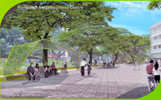
Fengshan Neighbourhood Centre