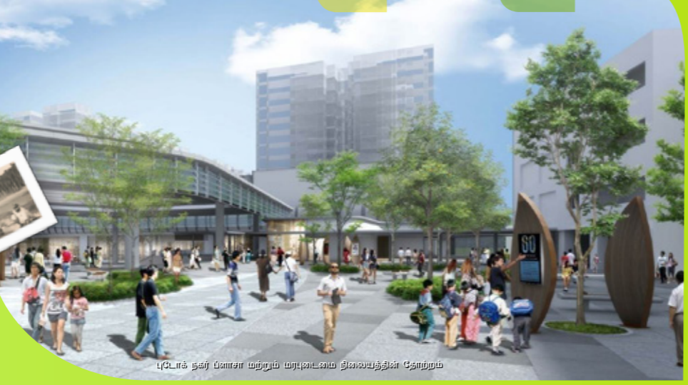
புடோக் நகர் ப்ளாசா மற்றும் மரபுடைமை நிலையத்தின் தோற்றம்