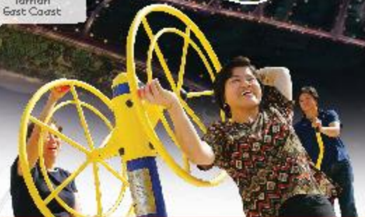
Night view of the Play Corridor Koridor Untuk Bermain Di Luar