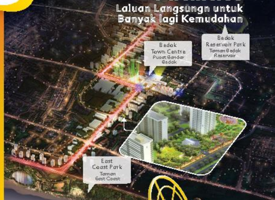
Bedok Town Centre Pusat Bandar Bedok