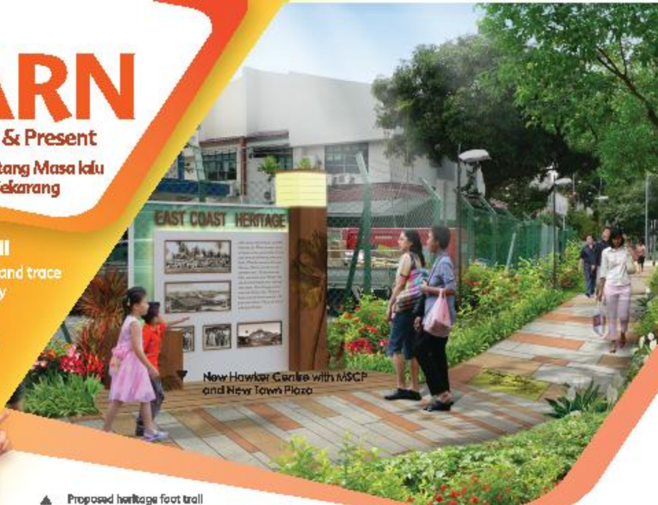
New Hawker Centre with MSCP and New Town Plaza

Berjalan-jalan di jalan kenangan dan selidiki jejak warisan, pantai dan masakan tradisional di East Coast!