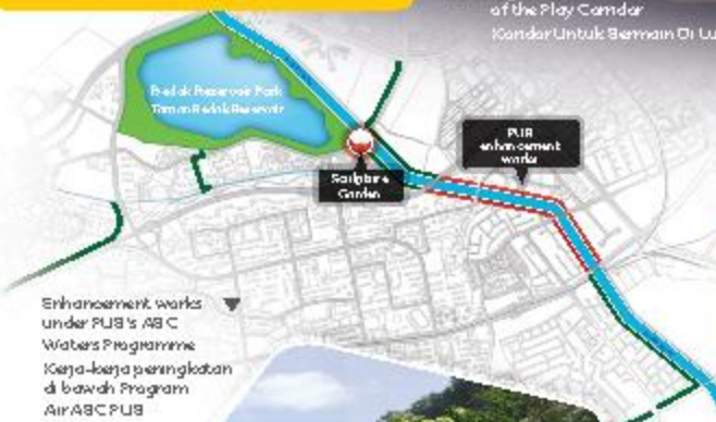
Enhancement works under PUB's ABC Waters Programme Kerja-kerja peningkatan di bawah Program Air ABC PUB

Penyambungan laluan yang baik ke East Coast, dengan identiti yang kaya, masyarakat yang aktif & laluan mudah ke tempat-tempat rekreasi.