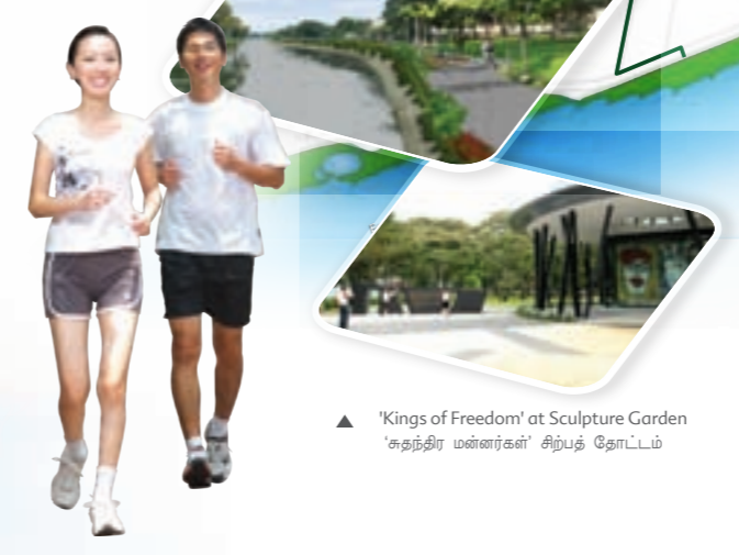
▲ 'Kings of Freedom' at Sculpture Garden 'சுதந்திர மன்னர்கள்' சிற்பத் தோட்டம்