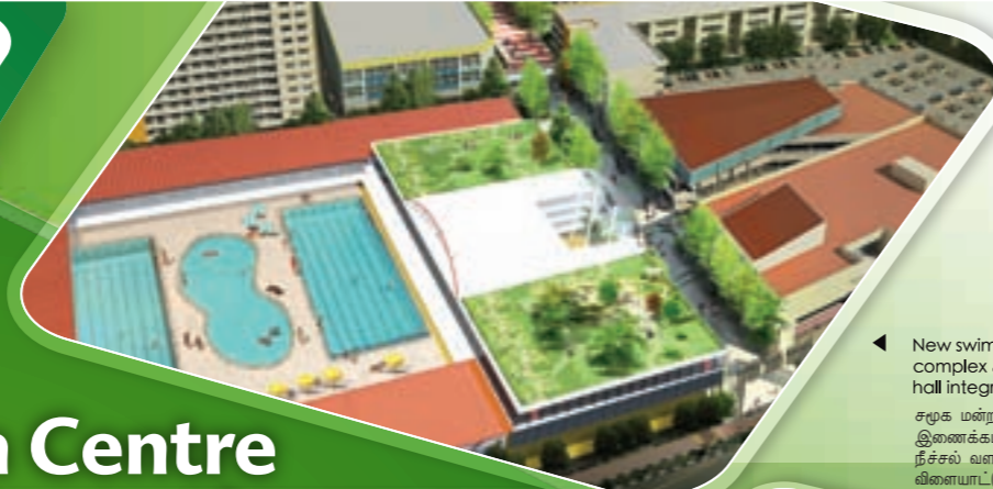
New swimming complex & sports hall integrated with a CC சமூக மன்றத்துடன் இணைக்கப்பட்ட புதிய நீச்சல் வளாகமும் விளையாட்டு மண்டபமும்