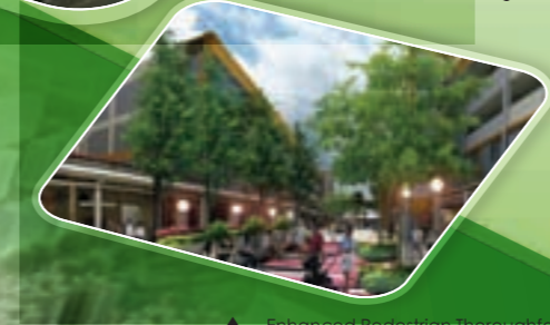
Enhanced Pedestrian Thoroughfare மேம்படுத்தப்பட்ட பாதசாரிகளுக்கான வழி