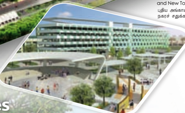
New Hawker Centre with MSCP and New Town Plaza புதிய அங்காடி மையமும் புதிய நகரச் சதுக்கம்