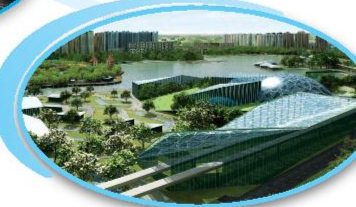
New attractions புதிய அம்சங்கள்

நீர்முகப்பு மூட்டல்கள், பலகை நடைபாதைகள், ஈரநிலங்கள், பூங்காக்கள், உலா சிதிகள் போன்ற பல புதிய அம்சங்கள் இருக்கும்.