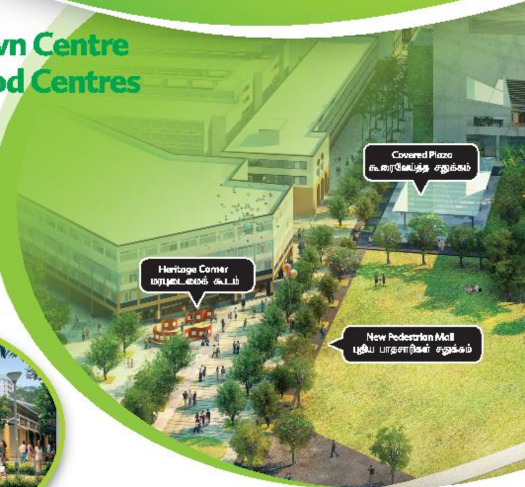
Covered Plaza கூரைவெய்த சதுக்கம்