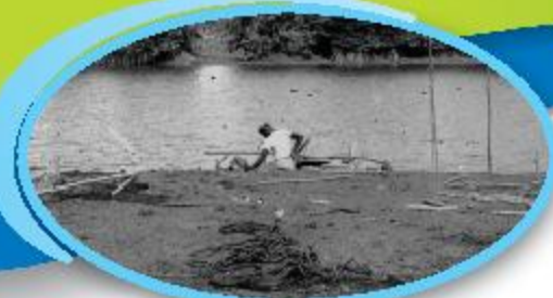
Sungei Jurong கங்கை ஐசிரோங்