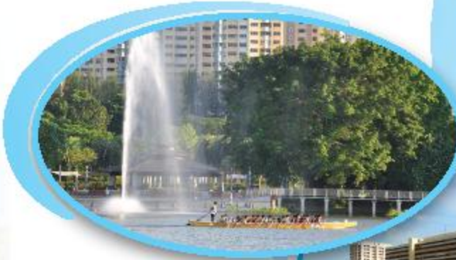
Jurong Lake ஐசிரோங் ஏரி

ஐசிரோங் ஏரிக்கான ABC நீர்த் திட்டம் ஐசிரோங் ஏரியில் ABC நீர்த் திட்டம் 25 செப்டம்பர் 2010-ல் திறக்கப்பட்டது. பலகை நடைபாதை, மீன்பிடித் தளங்கள், ஒரு மேடை மற்றும் பார்வையாளர் மாடம், ஒரு 20 மீட்டர் உயர நீர்தூற்று ஆகியவை உள்ளன.