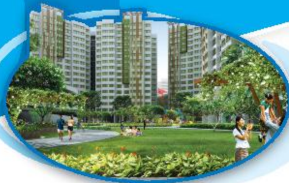
▲ New Housing - Boon Lay Meadow புதிய வீடமைப்பு - பூன் லே மெடோ