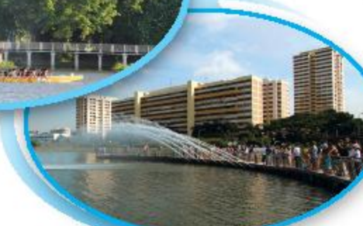
Pandan Reservoir பாண்டான் நீர்த்தேக்கம்