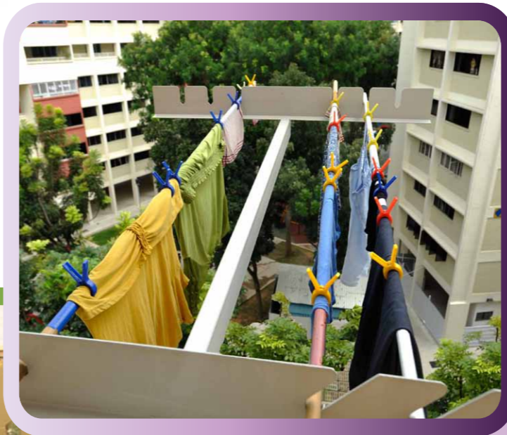
Clothes Drying Rack