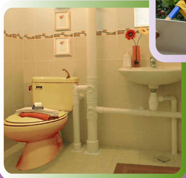
Improvement Works to Bathroom