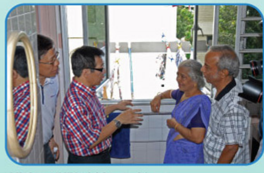
Minister (ND) visiting residents at the completed 1st HIP precinct.

Blks 701 to 716, Yishun ave 5 / St 71 Estimated Completion : 4Q 2012